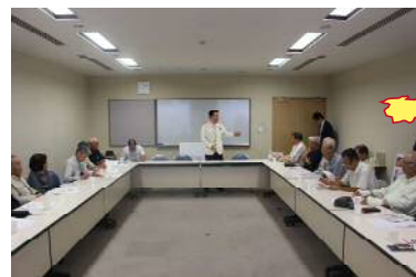
(7月4日河内長野市立市民交流センター) 憲法や介護問題など地域課題についてたくさんのご意見を頂きました。