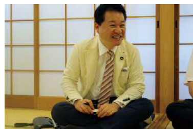
(7月11日大阪狭山市立コミュニティーセンター) 社会保障問題などについて活発な意見交換をさせて頂きました。